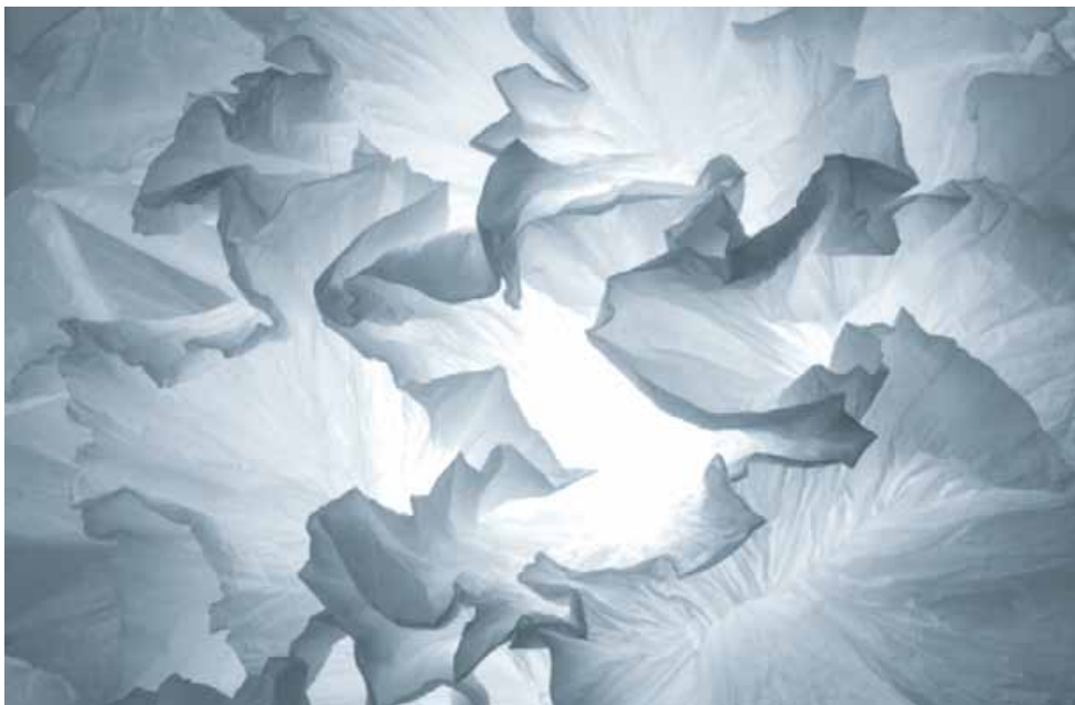
Coralys - Sculptures lumineuses Dimensions 60 x 50 cm

« La sculpture a l'air délicate, mais elle n'est pas fragile du tout. L'élasticité du papier a été préservée : la fibre s'est courbée, elle ne s'est pas cassée, elle a été travaillée en douceur, ce qui donne aux pièces toute leur robustesse en même temps que la légèreté. »