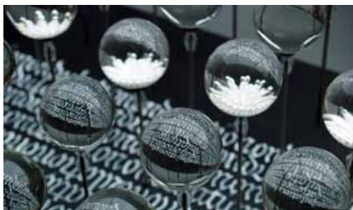
1/ « Ondulation » - Verre sculpté - Dimensions 100 x 40 x 30 cm 2/ Détail