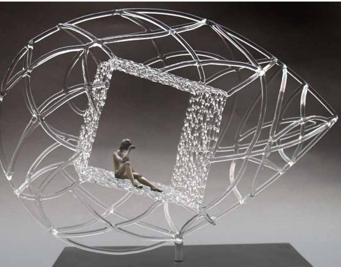
« Cocon de réflexion » - Verre sculpté - Dimensions 50 x 18 x 40 cm