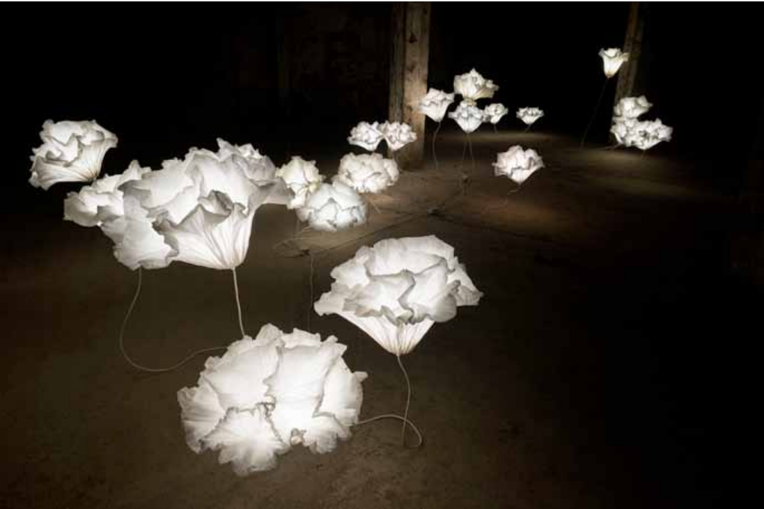
Coralys - Installation lumineuse Sculpture papier