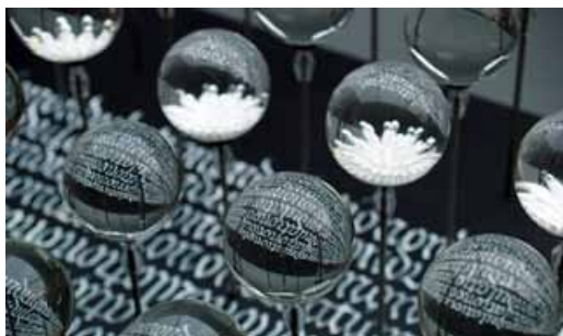
1/ « Ondulation » - Verre sculpté - Dimensions 100 x 40 x 30 cm 2/ Détail