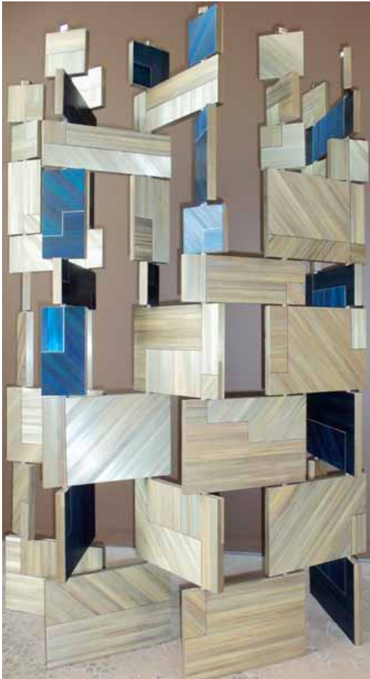
Paravent : « Dédale en clair-obscur » - dimensions 150 x 150 cm Marqueterie de paille