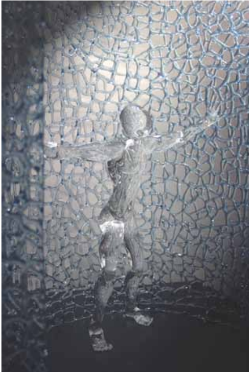
« Ouverture » (détail) Verre sculpté Dimensions 42 x 42 x 52 cm

Un personnage seul repousse les extrémités d'un mur pour se frayer un chemin, son chemin. Le mur réalisé en résille bleue frappe par sa délicatesse dès le premier regard. Adrian nous offre ici sa vision de la possibilité présente en chaque être humain de repousser ses propres limites afin d'ouvrir son champ d'action et son esprit.