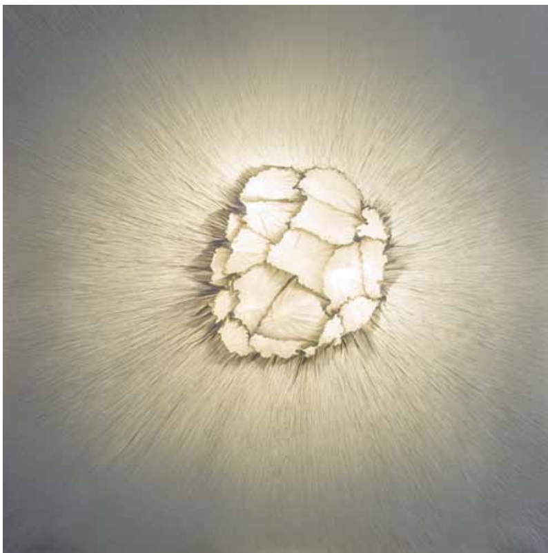
Caldera - Tableau lumineux papier