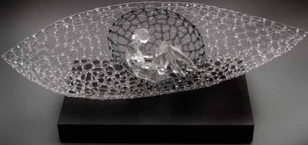
« Intemporelle » - 50 x 21 x 21 cm - Verre sculpté