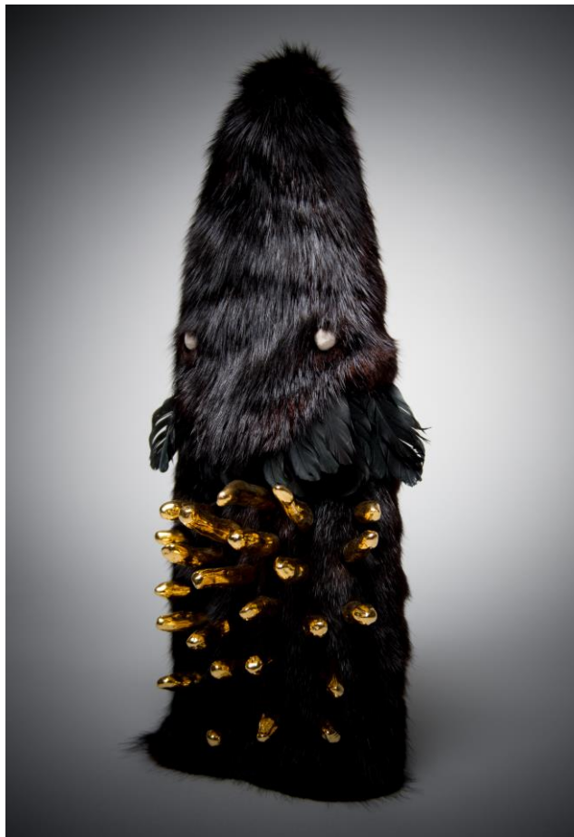
« Fétiche noir »

De 2012 à 2014, il expose à Strasbourg, notamment au Salon Résonance(s). En 2015, il reçoit le Prix de la Jeune Création Métiers d'Art à Paris.