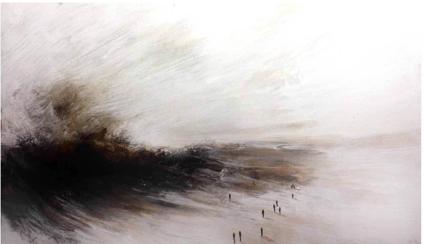
« Pâle Routine » - 100 x 70 cm - Technique mixte

Pourtant à travers le travail de Fabio Deronzier, bien plus que le simple prolongement des fascinations du 19 e siècle, on sent résonner les inquiétudes et peut être les désespérances du nôtre. Après que l'humain ait ouvert toutes les boîtes de Pandore, il se tient, microscopique mais digne, bien délimité et bien formé au centre de la toile, parfaitement résigné, comme un à-côté dévoyé retournant à sa nature première, en phase terminale d'une maladie incurable qui s'appellerait la Conscience .. »