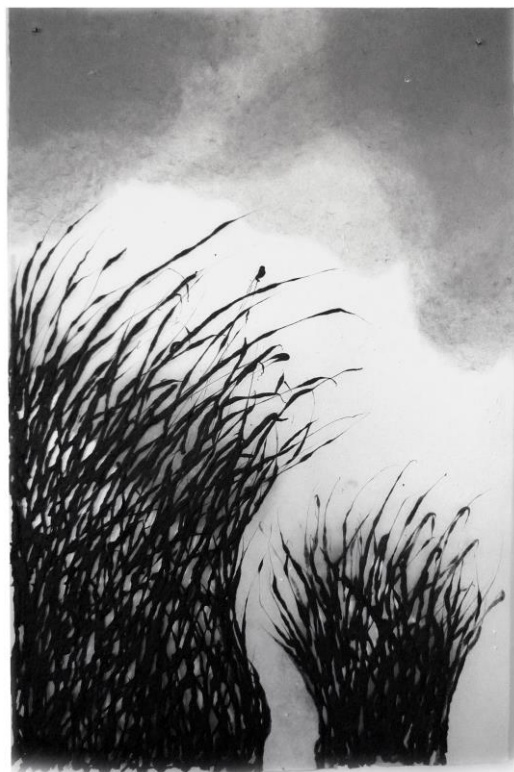
« Herbes Nuages »

Depuis 2001, il expose son travail dans de nombreuses galeries, en France comme à l'étranger (Londres, Genève...) et dans les musées (Japon, Lituanie...). Il a également participé au Festival des Jardins à Chaumont sur Loire en 2010, ainsi qu'au Salon Révélation en 2015.