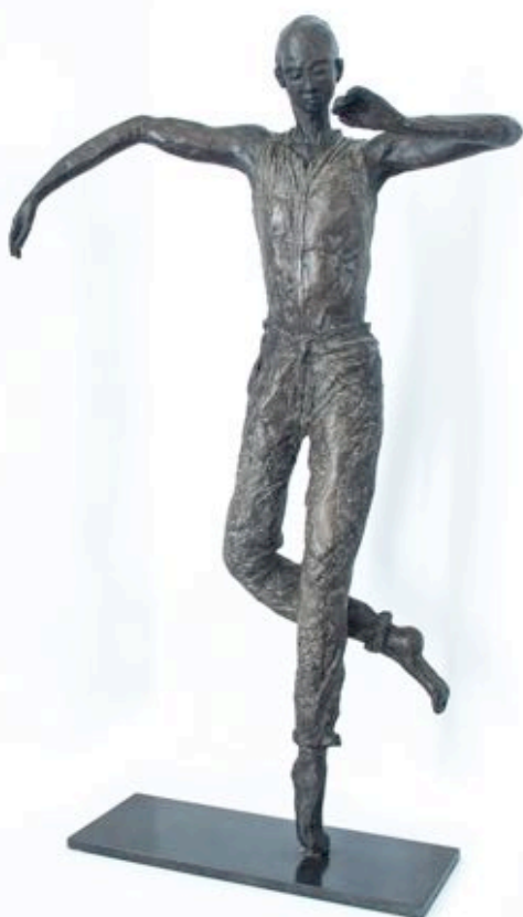
« Déséquilibre »

Réalisées en grès chamotté (parsemé de petits grains plus épais), recouvert d'engobe (porcelaine avec des oxydes) puis émaillé, les femmes de céramique de Marie-Madeleine sont exposées depuis 2002 dans de nombreux festivals, galeries et salons en France et en exclusivité à la galerie parisienne French Arts Factory depuis septembre 2015.