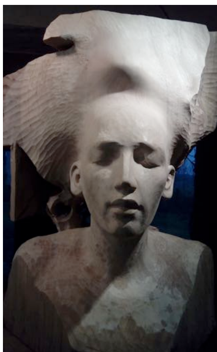
« Soundscape »