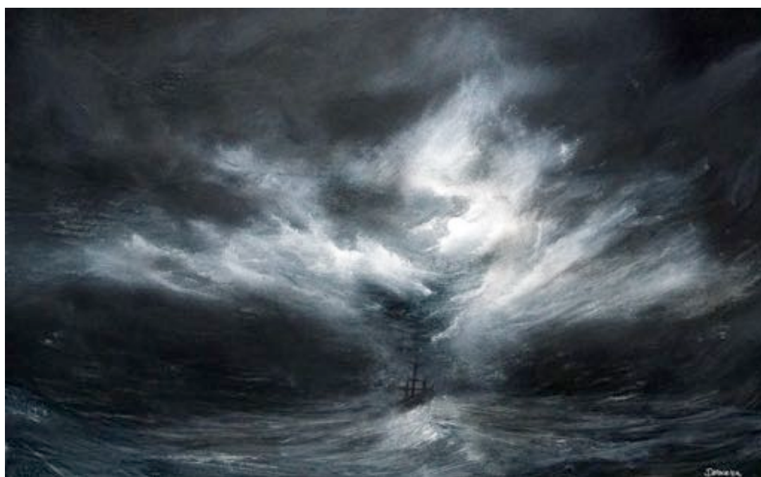
« Figé dans les temps » - 29,7 x 42 cm – Aquarelle modifiée