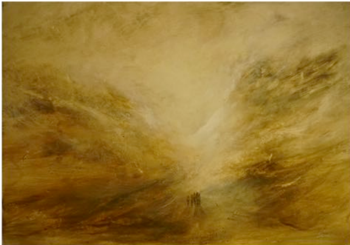
« A ceux devant » - 41 x 30 cm – Aquarelle modifiée

La galerie French Arts Factory représente Fabio Deronzier de façon permanente et lui consacre une exposition personnelle chaque semestre. L'artiste a par ailleurs participé au Forum des arts de St Malo en mai dernier, et à des expositions collectives des galeries 361° d'Aix en Provence et Agora de Salon de Provence. Ses œuvres sont présentes dans des collections privées en France et à l'étranger.