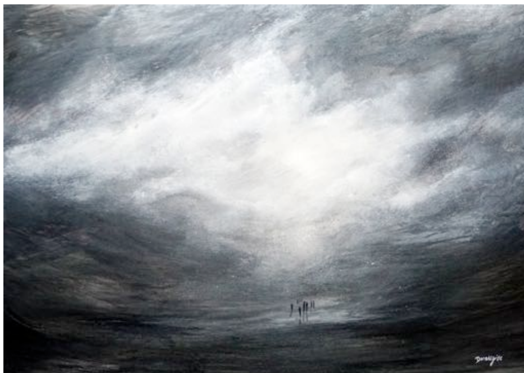
« Présence » - 29,7 x 42 cm – Aquarelle modifiée