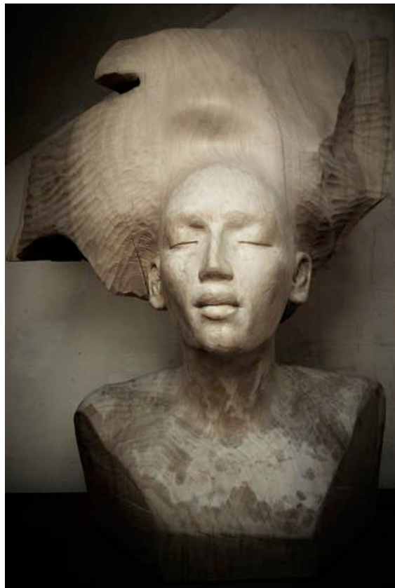
Soundscape – Sculpture Bois - 66 x 43 x 69 cm