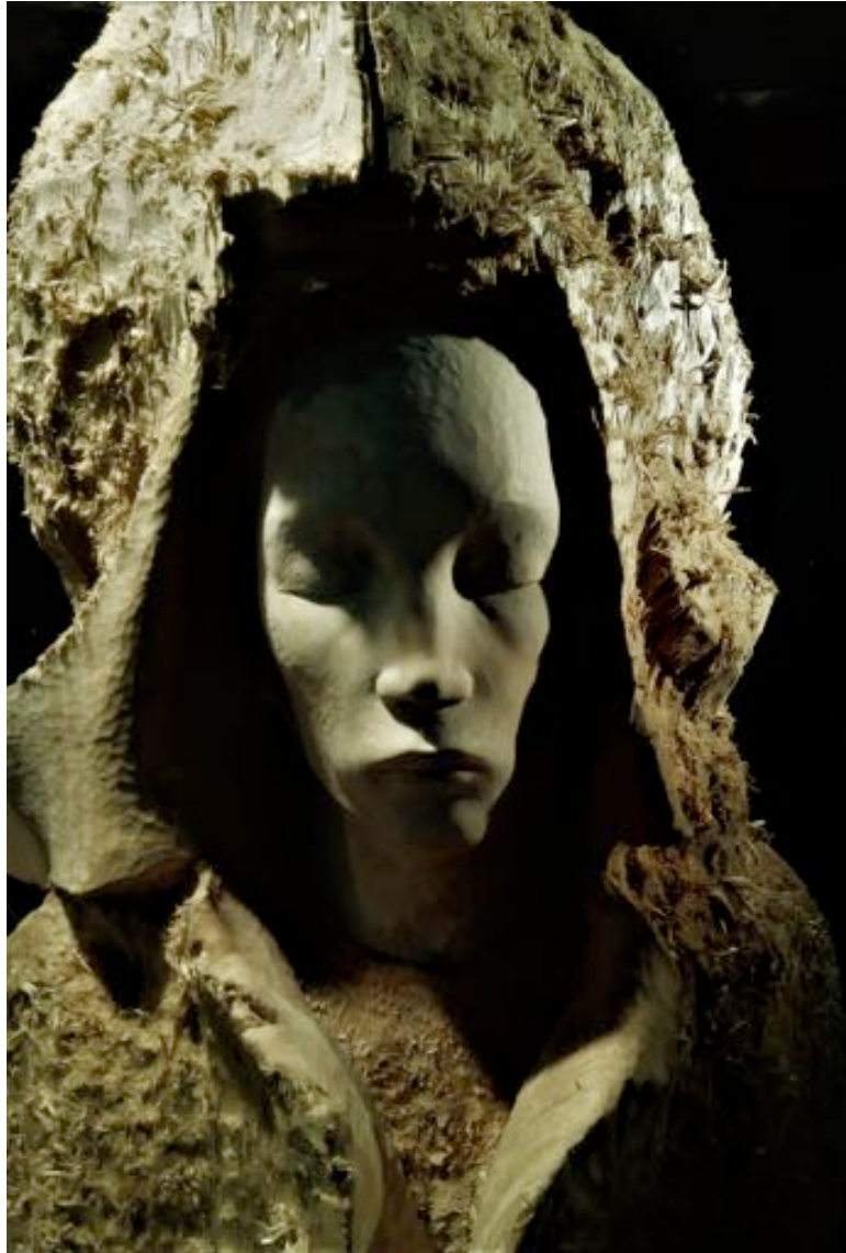
Early Shaman - Sculpture Bois