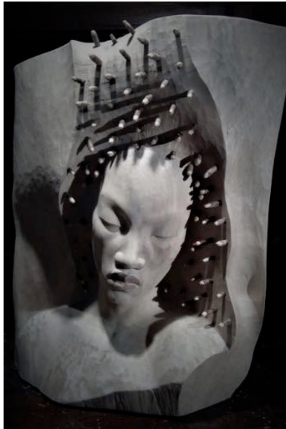
La couleur rouge – Sculpture Bois – 54 x 44 x 30 cm