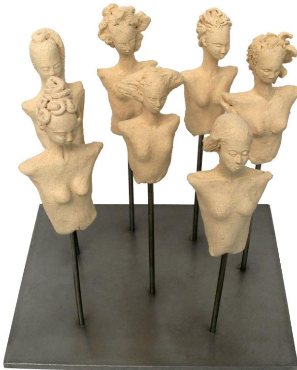
« Visages »

Réalisées en grès chamotté (parsemé de petits grains plus épais), recouvert d'engobe (porcelaine avec des oxydes) puis émaillé, les femmes de céramique de Marie-Madeleine sont exposées depuis 2002 dans de nombreux festivals, galeries et salons en France, dont au Salon des Créateurs de l'Espace des Blancs Manteaux à Paris en décembre dernier.