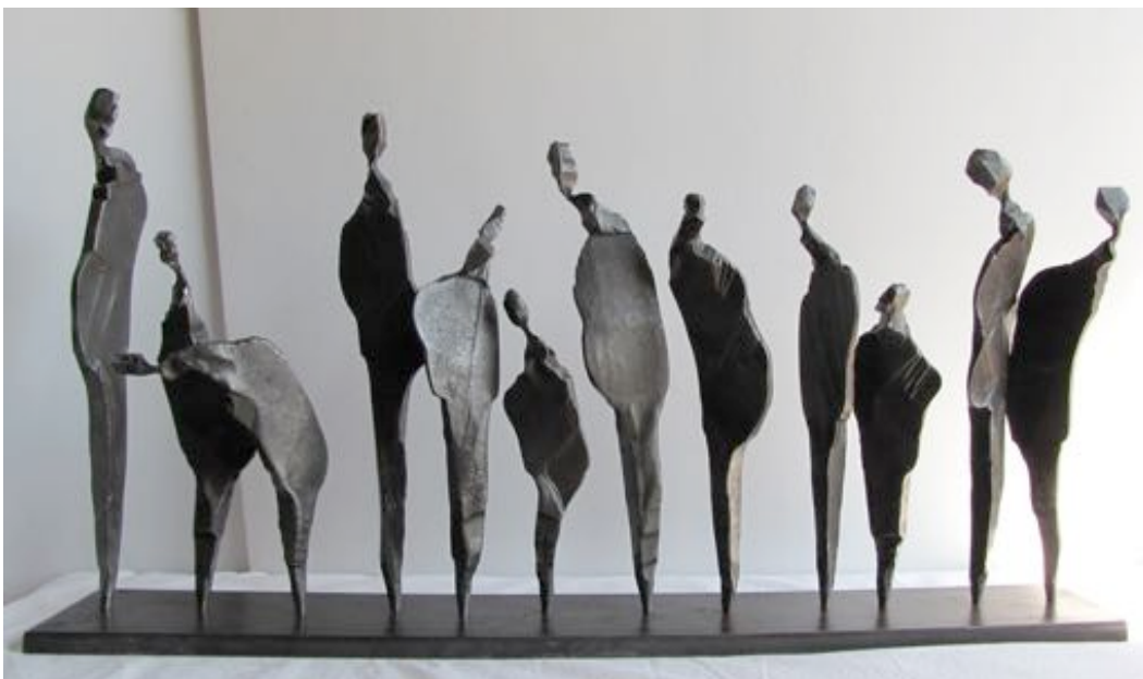
« Sculpture vivante 1 »

Depuis 2013, ses compositions l'entraînent désormais vers des réalisations monumentales.