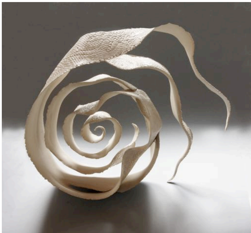
"Grande mue spirale blanche"

Depuis 2009, l'artiste présente ses créations dans de nombreux événements organisés en France autour de la céramique.