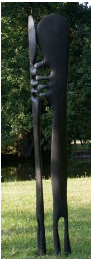
« Pompéi »

La pureté des lignes et l'esprit contemporain de son travail lui permettent d'exposer ses créations en France et à travers le monde, de Paris à Courchevel, de New York à Bruxelles, notamment en galeries et durant de nombreux événements autour de l'univers du bois et de la sculpture.